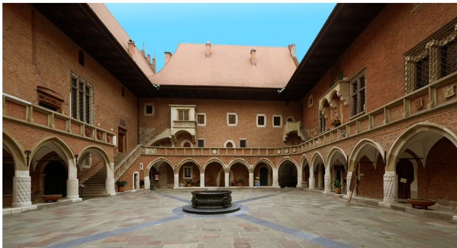
◀ Collegium Maius Uniwersytetu Jagiellońskiego, siedziba Muzeum Uniwersytetu Jagiellońskiego.